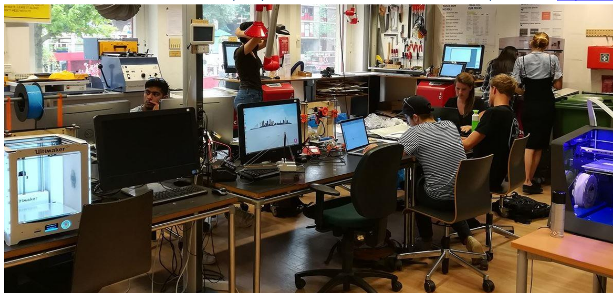
Fab Lab Rotterdam

What should be the EU policy for Mediterranean 'third places'? https://theco