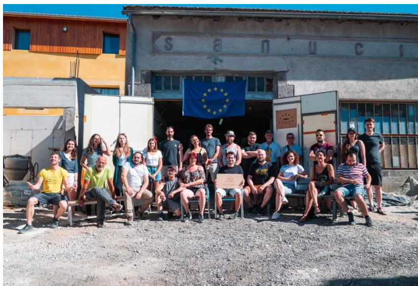
Vulca, Réseau européen

Une heure de trajet en bus, mini « Paris by night ». 23 h 15 : arrivée à l'hôtel