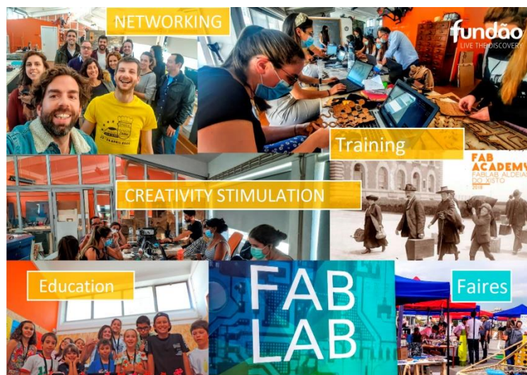
Aldeias Do Xisto, Fundao