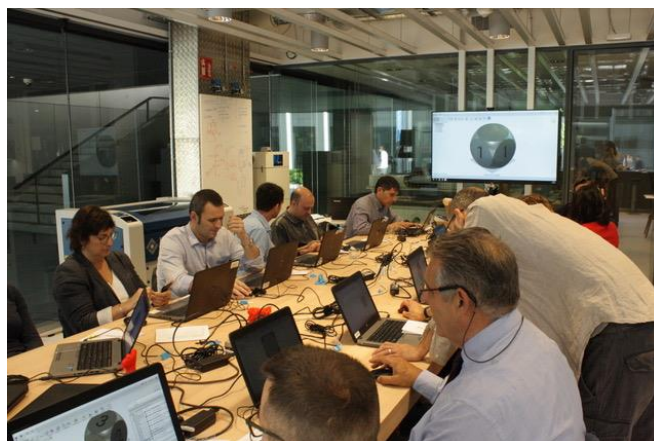
San Cugat, Catalonia