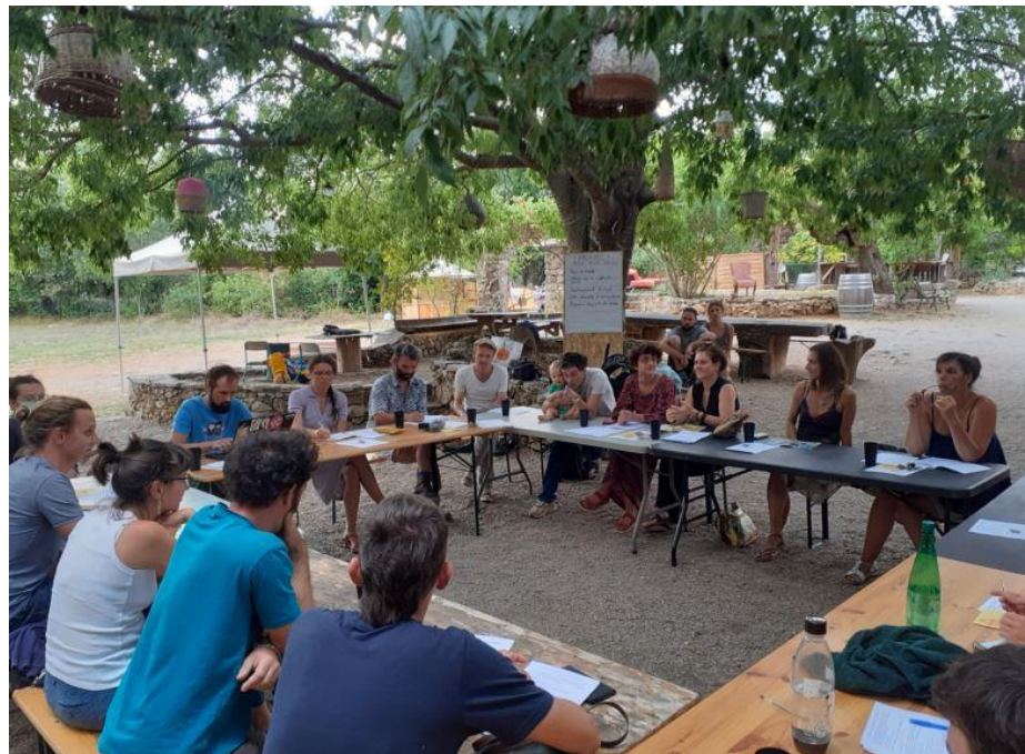
Bouillon Cube / La Grange, Le Causse de la Selle, Occitanie