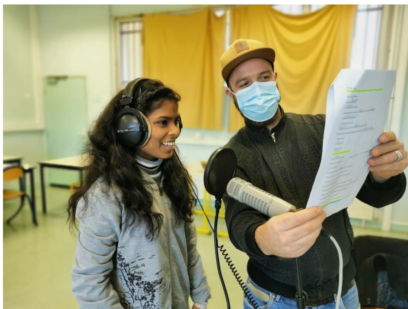
La fabrique francophone, Cahors, Occitanie